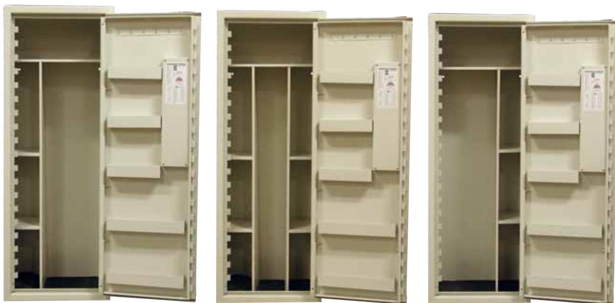
SP88, det finns många kopior men bara ett original. Nöj dej inte med en dålig kopia...

Onda tungor gör gällande att man skadar sina värdeföremål när man tar i och ur saker i skåp med kamlåsning.